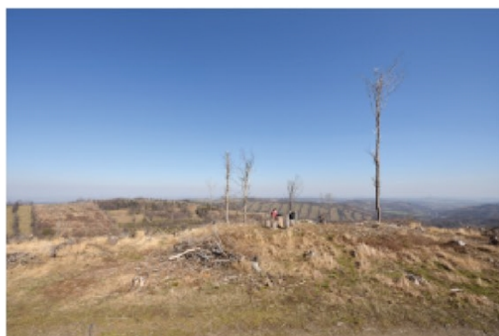
Posezení na Jindřichově vyhlídce, 2020 (Robert Kořínek)