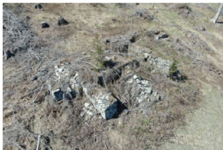
Zbytky kamenných základů, 2019