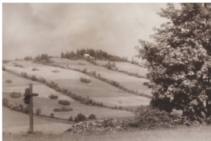
Pohled na údolí Ztracené Vody a Jindřichovu vyhlídku, nedatováno