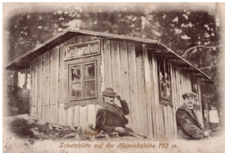
Původní útulna na vyhlídce, 1902

Chata byla řešena jako částečně podsklepená patrová dřevěná stavba obdélníkového půdorysu se sedlovou střechou. Posazená byla na kamenném základovém zdivu vystupujícím nad úroveň okolního terénu, vstupovalo se do ní po